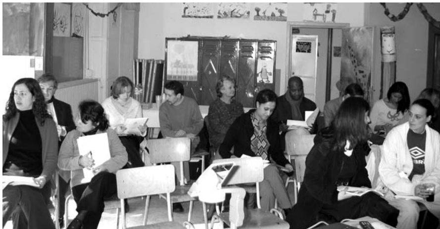
Les participants à la journée d'information-formation dans les locaux de la MQSA

La Maison de Quartier Saint Antoine a organisé une journée d'information-formation au mois de mars sur ce Cd-Rom pour sensibiliser les travailleurs de la commune de Forest à cet outil. Au programme : présentation du projet, de son matériel et de sa philosophie, ateliers et discussions. La journée s'est très bien passée!